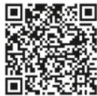
Meldeplattform QR-Code Meine Umwelt-App

Die Landesanstalt für Bienenkunde der Universität Hohenheim prüft die eingehenden Meldungen und gibt bei Nestfunden den Meldenden weitere Instruktionen und unterstützt bei der Vermittlung von sachkundigen Personen für die Nestentfernung. Für die Beseitigung von Primärnestern im Frühjahr hat das Ministerium für Ernährung, Ländlichen Raum und Verbraucherschutz (MLR) Finanzmittel zur Verfügung gestellt, welche durch den Landesverband Badischer Imker e.V. verwaltet werden. So können pro Entfernung eines Primärnestes durch eine sachkundige Person 60 Euro auf Nachweis ausgezahlt werden. Nester mit Arbeiterinnen sollten ausschließlich von sachkundigen Personen mit Schutzausrüstung entfernt werden, da eine Stichgefahr droht!