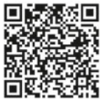
QR-Code Asiatische Hornisse

Sichtungen von Einzeltieren und insbesondere Nester sollen weiterhin ausschließlich über die Meldeplattform der Landesanstalt für Umwelt gemeldet werden. Dies kann über die Homepage der Landesanstalt für Umwelt (LUBW) oder über die kostenlose „Meine Umwelt-App“ erfolgen: